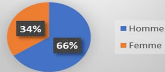
Graphique: taux de réussite par sexe à l'examen de certification CQB selon l'objectif de 100 apprenants du projet planetGOLD