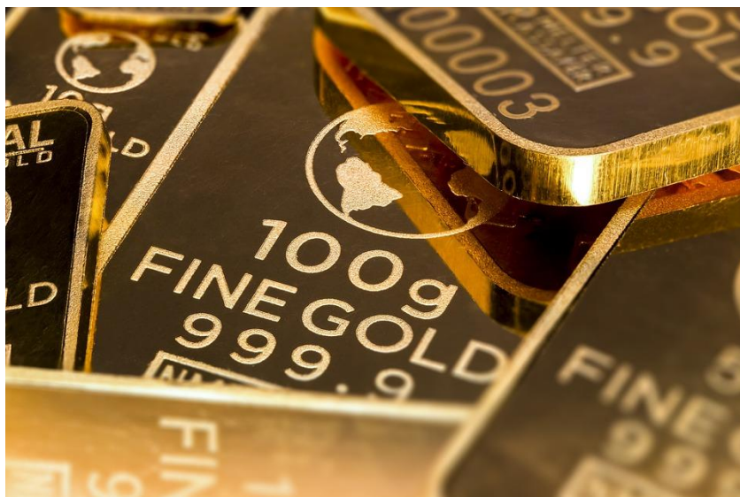
Foto1: Barra de oro.

Puno, Ayacucho y Arequipa, esta iniciativa ha posicionado al Perú como el primer productor global de oro responsable desde la MAPE. La precondition para ser certificados es contar con la formalización y cumplir con los criterios de los sellos internacionales.