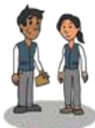
GESTOR FINANCIERO RURAL