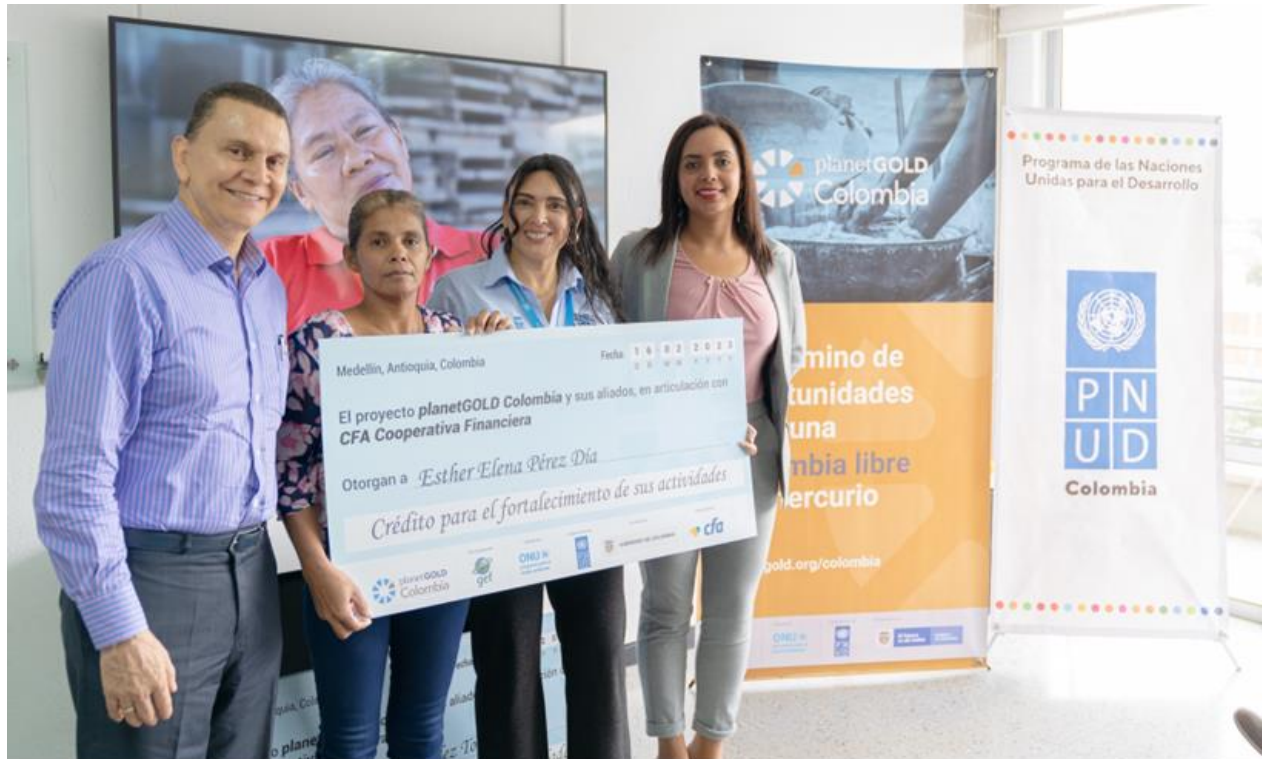
Figura 5: planetGOLD Colombia y el equipo de CFA presentan un cheque por un crédito a un minero beneficiario del mecanismo financiero.

financiación e inspirar a otros a dar los pasos necesarios para profesionalizar su forma de trabajo y romper el vínculo con los actores informales. Este proceso será gradual y no todos los mineros artesanales querrán hacer esta transición.