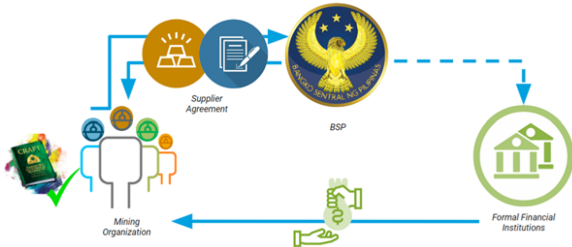
Figura 2: Mecanismo para usar como garantía un acuerdo de suministro entre los mineros y el Banco Central de Filipinas.

social controlada por mineros, lo que permitirá el acceso a la financiación sin depender de las instituciones financieras formales.