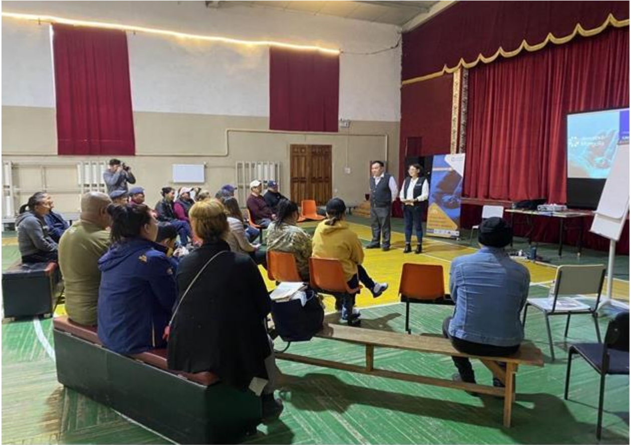
Figura 4: Capacitación para los mineros sobre libertad financiera y cooperativas de ahorro y crédito ofrecida por el equipo de pG Mongolia