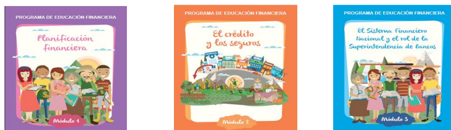
Diagrama 1: Malla curricular taller de educación financiera básica

Si el Gestor Social determina la necesidad de educación financiera, BanEcuador B.P. ha desarrollado un Programa de Educación Financiera que contiene una malla curricular sobre dos ejes: “Taller educación financiera básica” (8 horas de duración) y otro “Taller fortalecimiento organizativo” (8 horas) 8 .