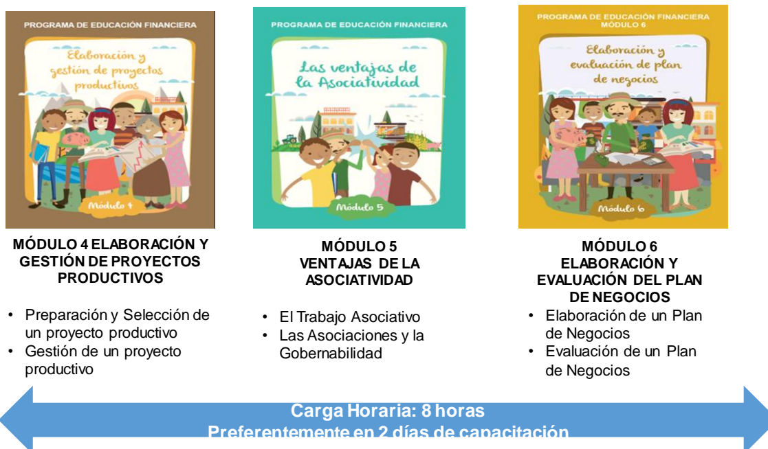
Diagrama 2: Malla curricular taller de fortalecimiento organizativo